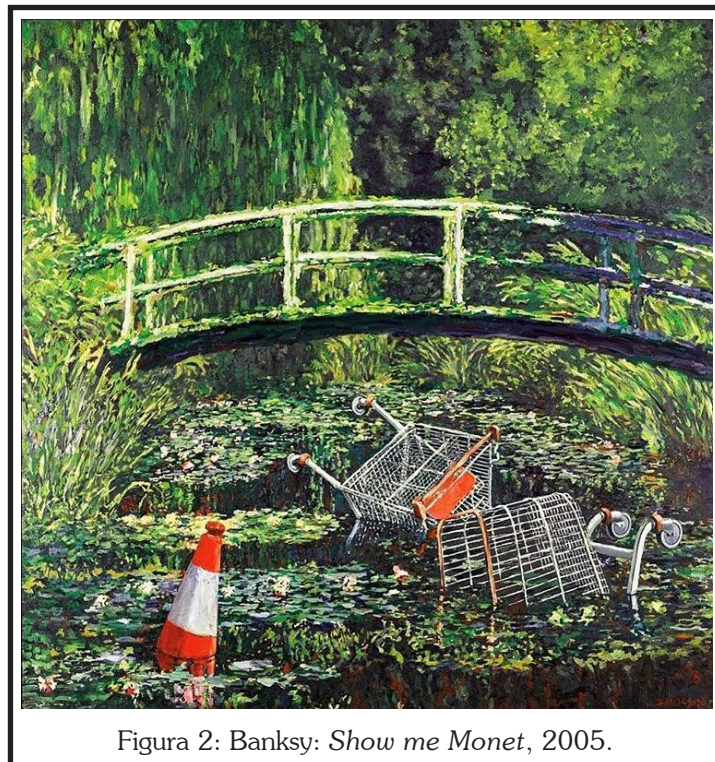
Figura 2: Banksy: Show me Monet , 2005.

Así, Banksy, en su pintura llamada Show me Monet :