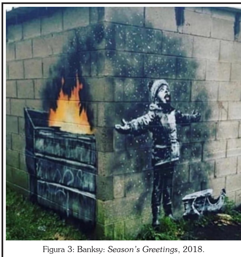
Figura 3: Banksy: Season's Greetings , 2018.

El estencil de Banksy, abajo reproducido, presenta de forma amplia esa idea holística que liga el destino de la especie humana al medio ambiente, que no es suyo, pero sí compartido por todas las formas de vida, sensitivas o no.