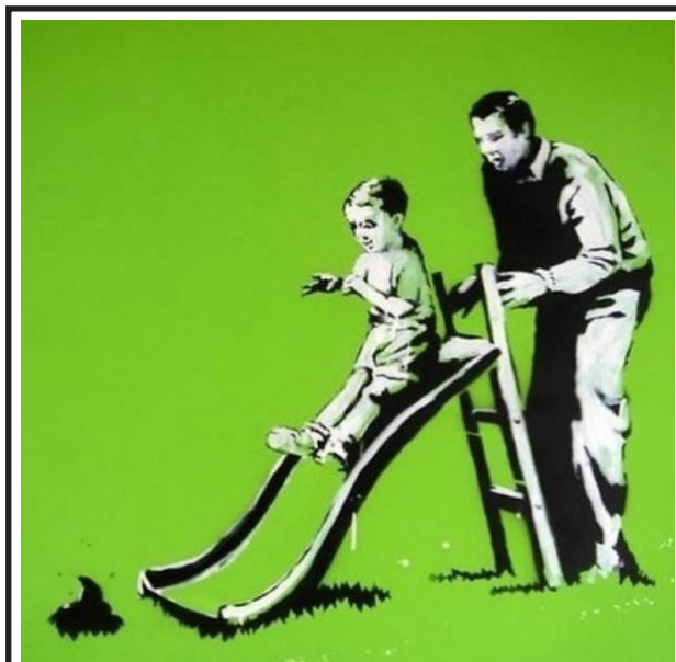
Figura 5: Banksy: No Title, 2020.

En ese sentido, la posibilidad de un pacto intergeneracional queda reducido a una nada, que puede ser comprendido en este último estencil de Banksy: