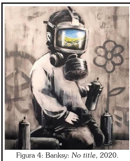
Figura 4: Banksy: No title, 2020.