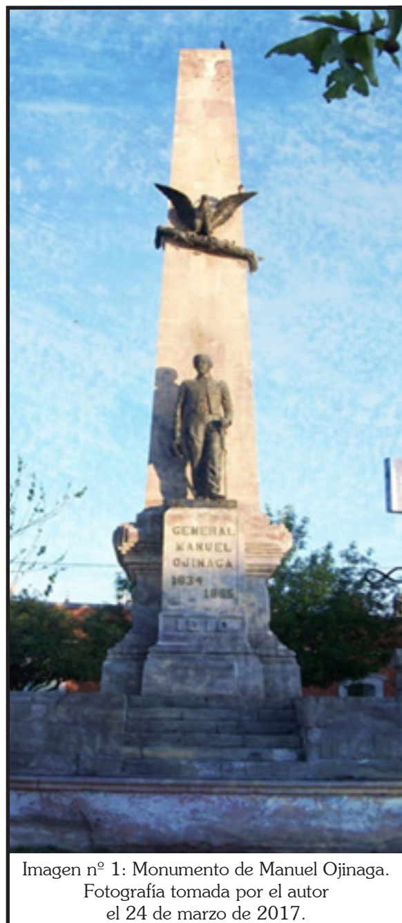
Imagen n° 1: Monumento de Manuel Ojinaga.

El monumento de Ojinaga se sitúa entre las calles Ocampo, Bolívar, Mina y 12º de la ciudad de Chihuahua. En 1910, se encontraba casi a las afueras de la mancha urbana,