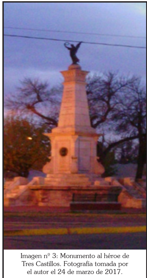
Imagen n° 3: Monumento al héroe de Tres Castillos.

sombría. Es un punto en el tiempo que marca un antes y un después. En la batalla de Tres Castillos, a mediados del mes de octubre de 1880, se pone fin a las grandes incursiones indias, además de que en tal acción se dio muerte a uno de los más temidos guerreros